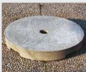
ZAV04 / ZAV05